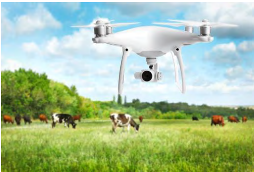
Drone die boven koeien vliegt

Volg de stappen hierna om deze opdracht uit te voeren.