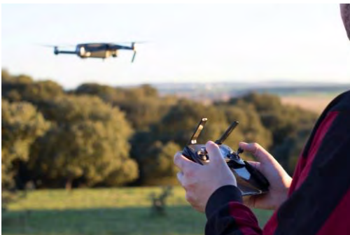
Drone tijdens opstijgen

Volg de stappen hieronder om deze opdracht uit te voeren.