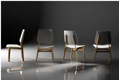
Maak een parcours met vier stoelen

Voor deze opdracht heb je het volgende nodig: