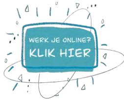
Link naar het instructiefilmpje

Voor deze opdracht heb je het volgende nodig: